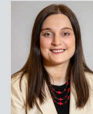
Enisa Kurpejovic Zentralstelle – Sektion III Arbeitsmarkt

+43 1 71100 630213 christian.lacina@bmaw.gv.at